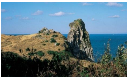
吉岐パワースポットのひとつ「猿岩」

※携帯電話の方やその他詳細については下記をご確認ください。 「ながさきしまとく通貨」ホームページ ⇒ http://www.shimatoku.com/