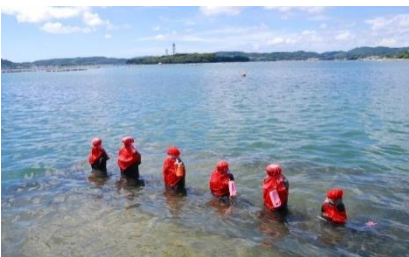
吉岐パワースポットのひとつ「はらほげ地蔵」

※携帯電話の方やその他詳細については下記をご確認ください。 「ながさきしまとく通貨」ホームページ ⇒ http://www.shimatoku.com/